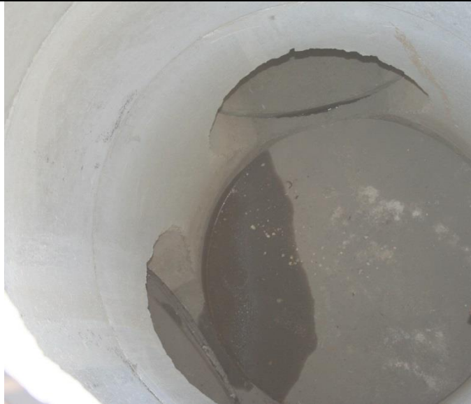
Pregled uljevnog okna