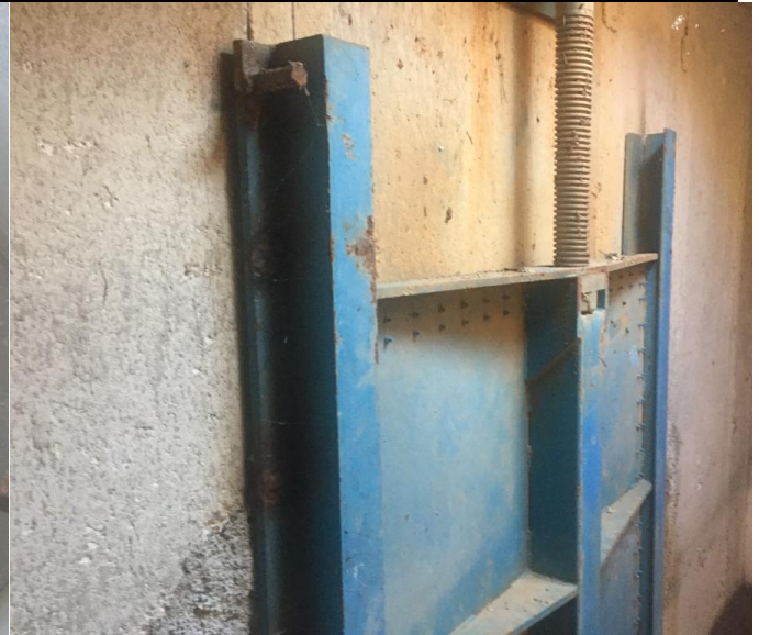
Pregled zapornice ulaz