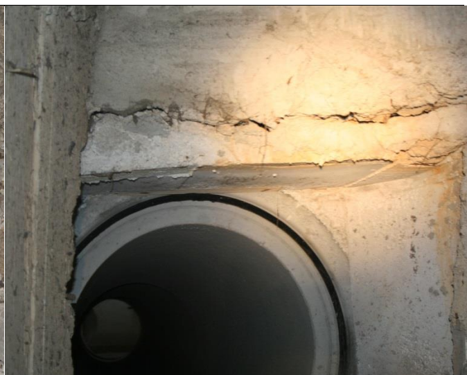
Pregled zida oko izljevne cijevi