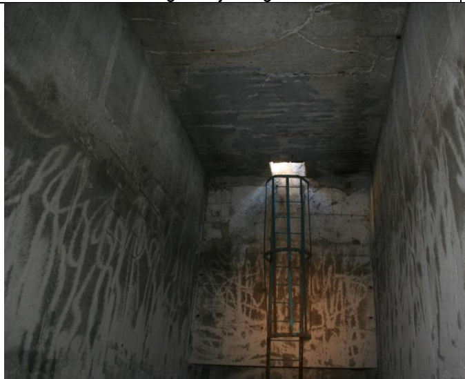
Pregled ulaznog dijela u separator – ljestve s leđobranom