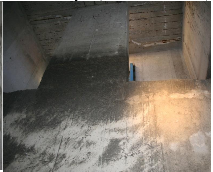
Pregled uljevnog dijela u separator