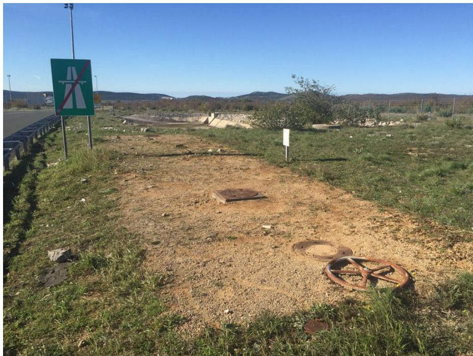
Slika 2. Fotodokumentirani prikaz