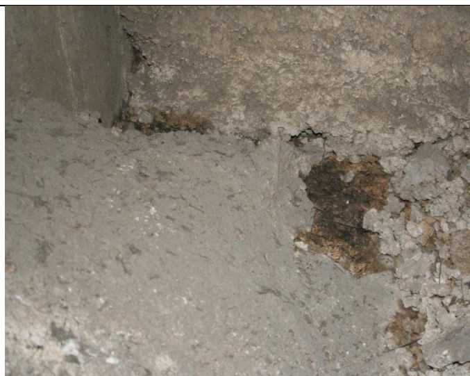
Pregled prelivnog korita- izlaz iz separatora_kineta korita