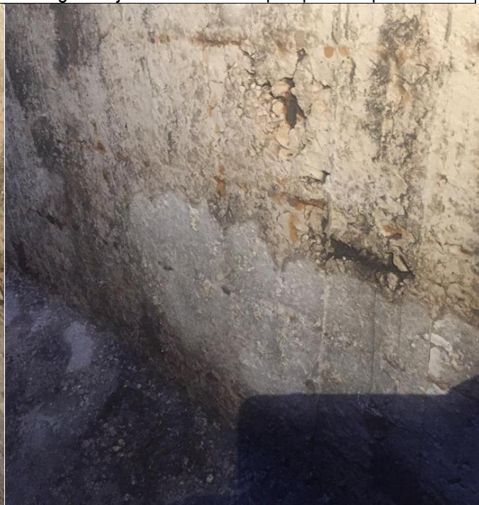
Pregled stijenke zidova i stropne ploče separatora