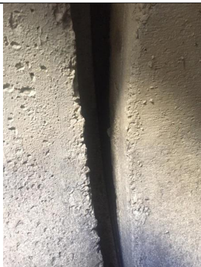
Spoj izljevne cijevi