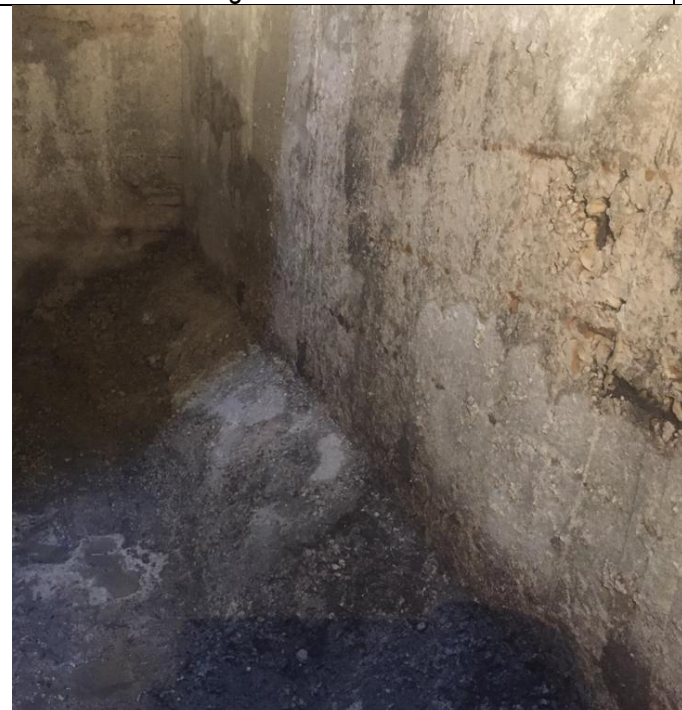
Pregled dna i okolne vute