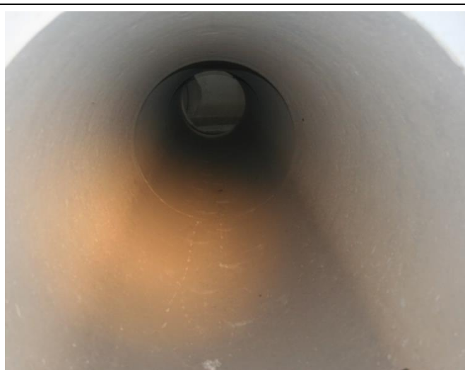
Odvodna cijev prema laguni.