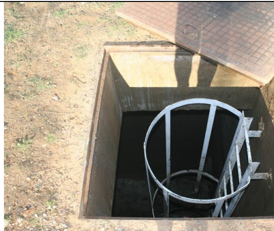
Pregled ulaza i ljestvi s leđobranom