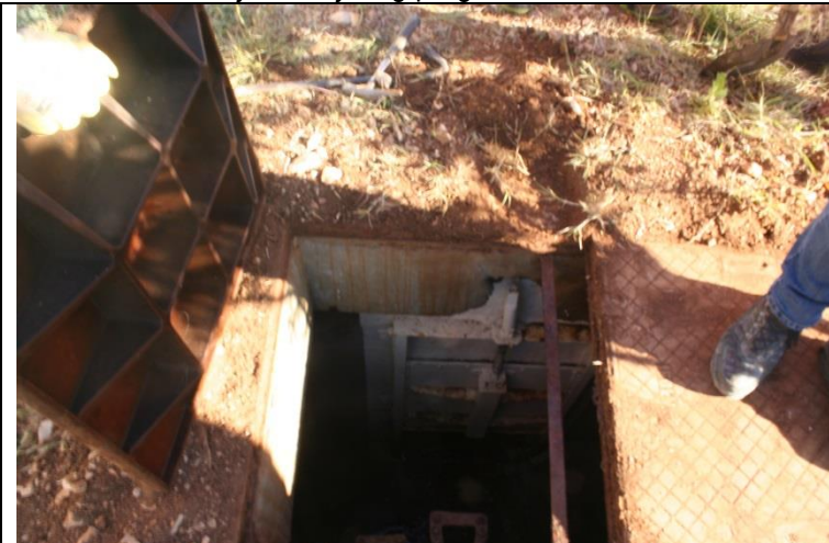
Pregled zapornice ulaz