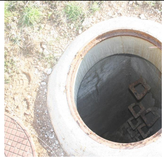
Pregled izljevnog okna