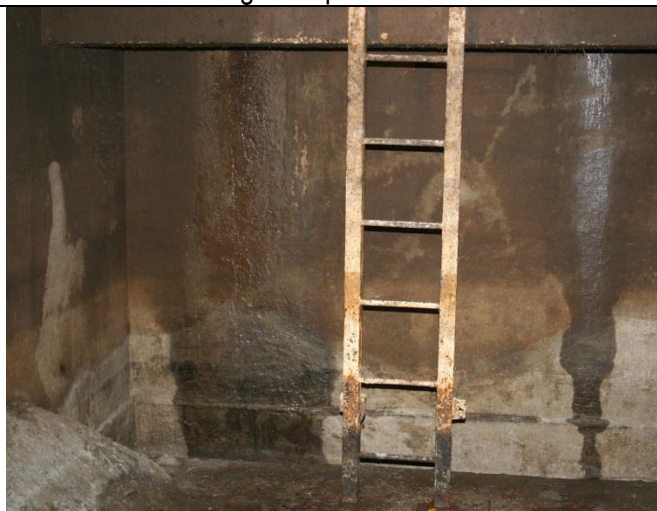
Pregled ljestvi i taložnice