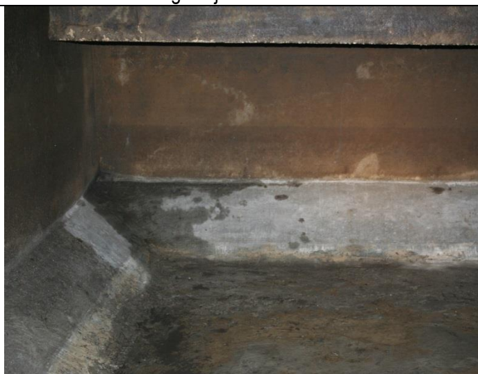
Pregled dna i okolne vute