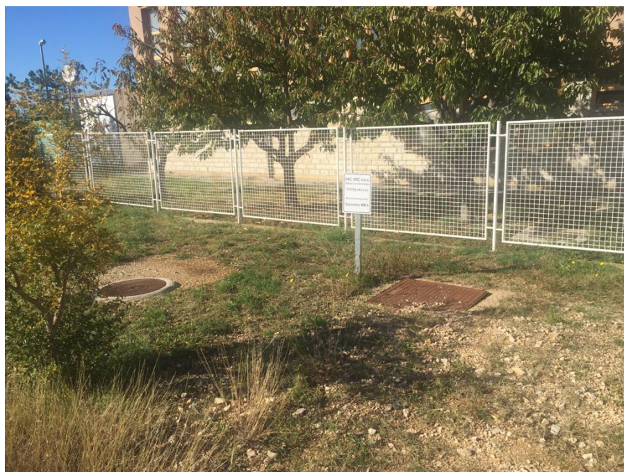
Slika 2 Fotodokumentirani prikaz