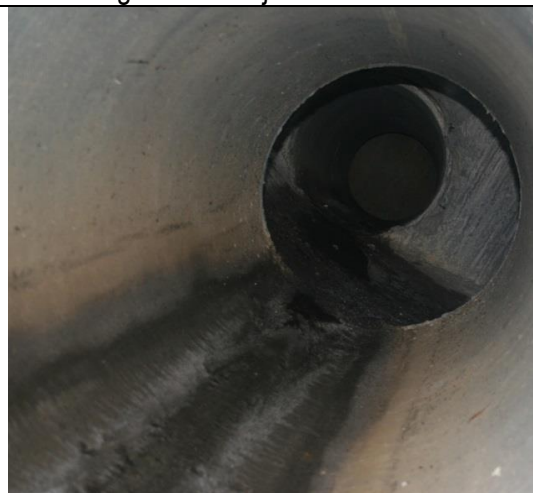
Pregled dolaznog kolektora