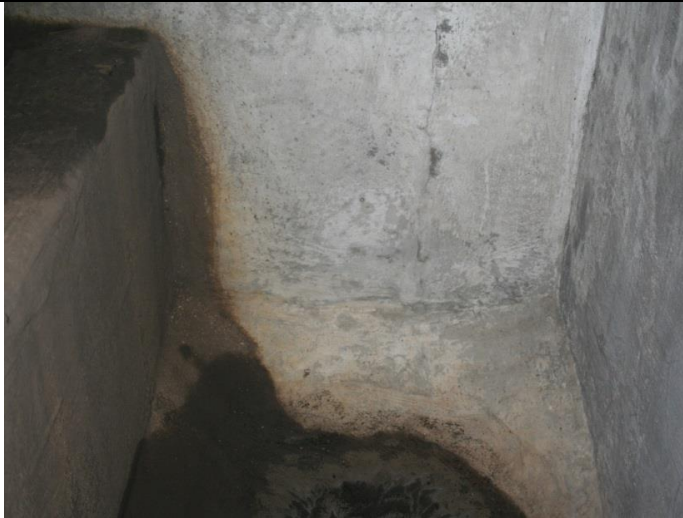
Pregled preljevnog korita- izlaz iz separatora