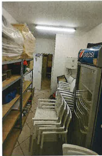
PUO BOŠNJACI - JUG