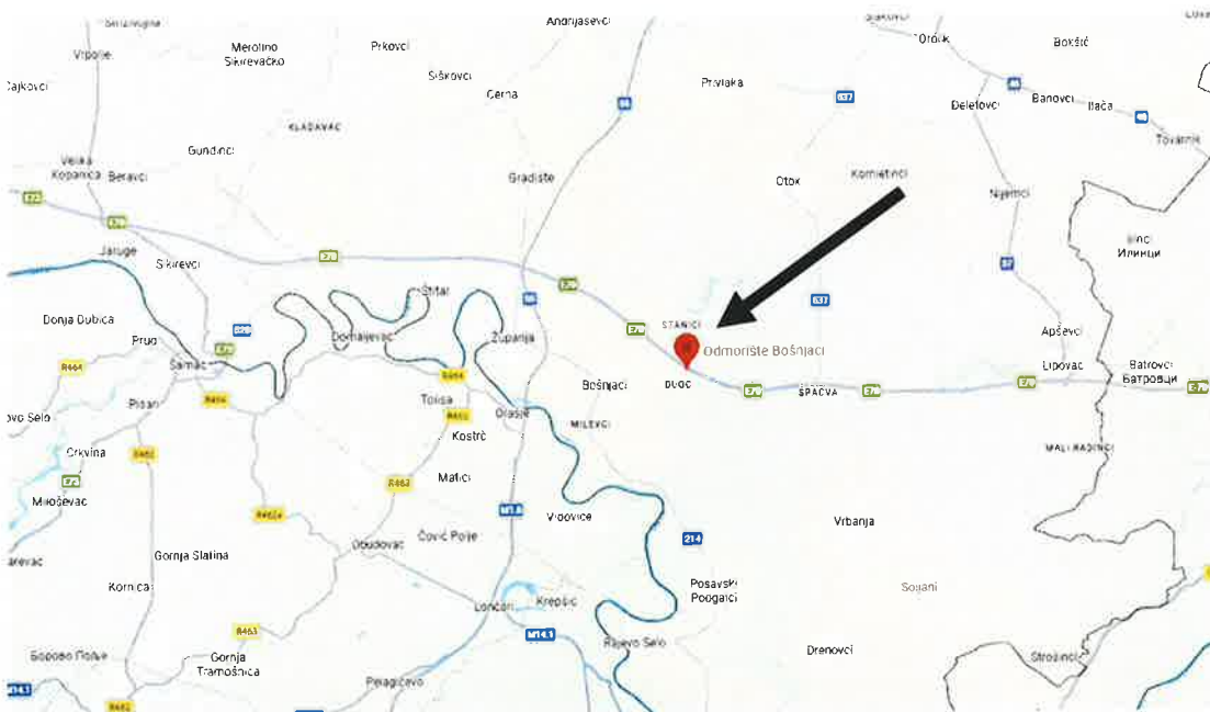
Prikaz lokacije na Google karti