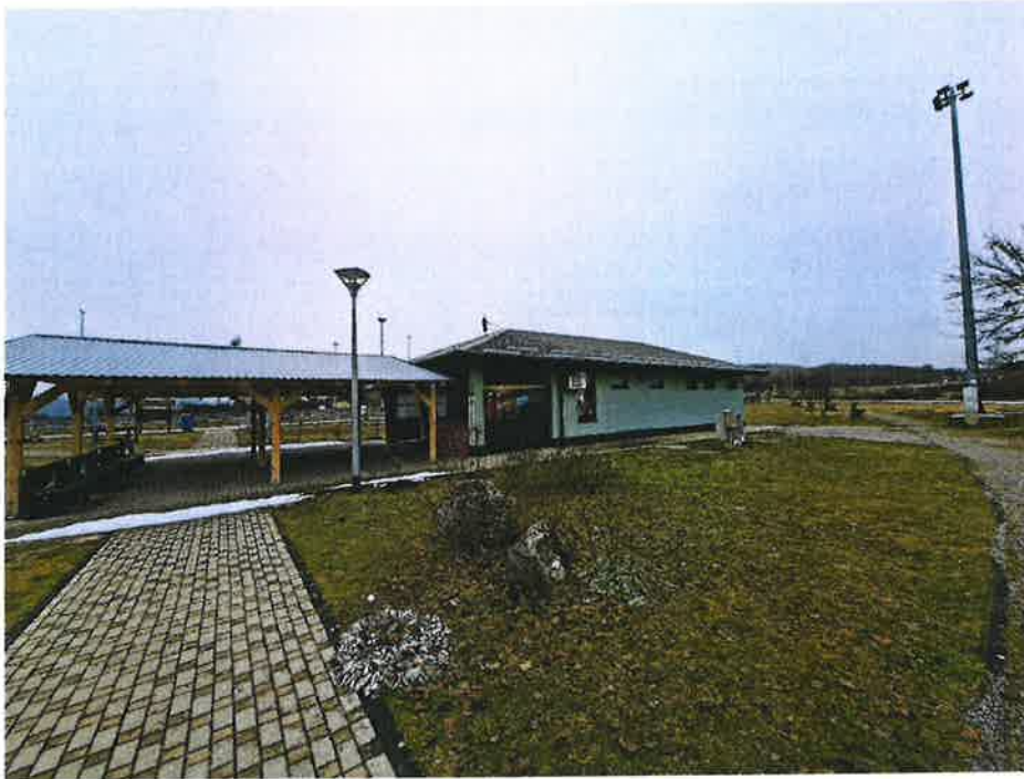
PUO LIČKI OSIK - ZAPAD