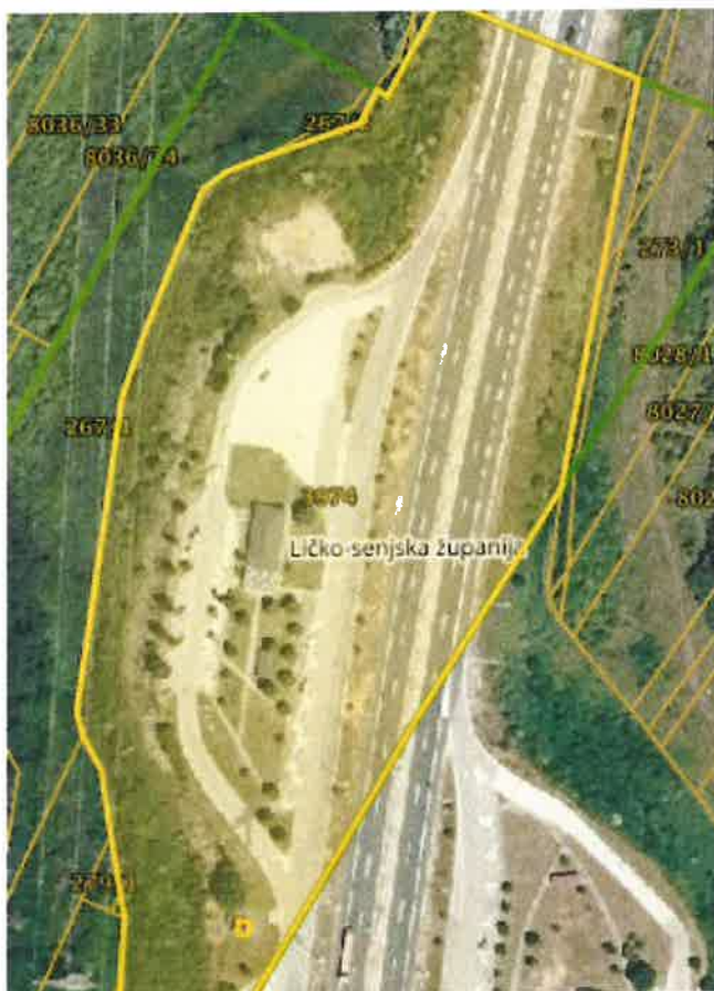
Prikaz lokacije Lički Osik – zapad na DOF-u