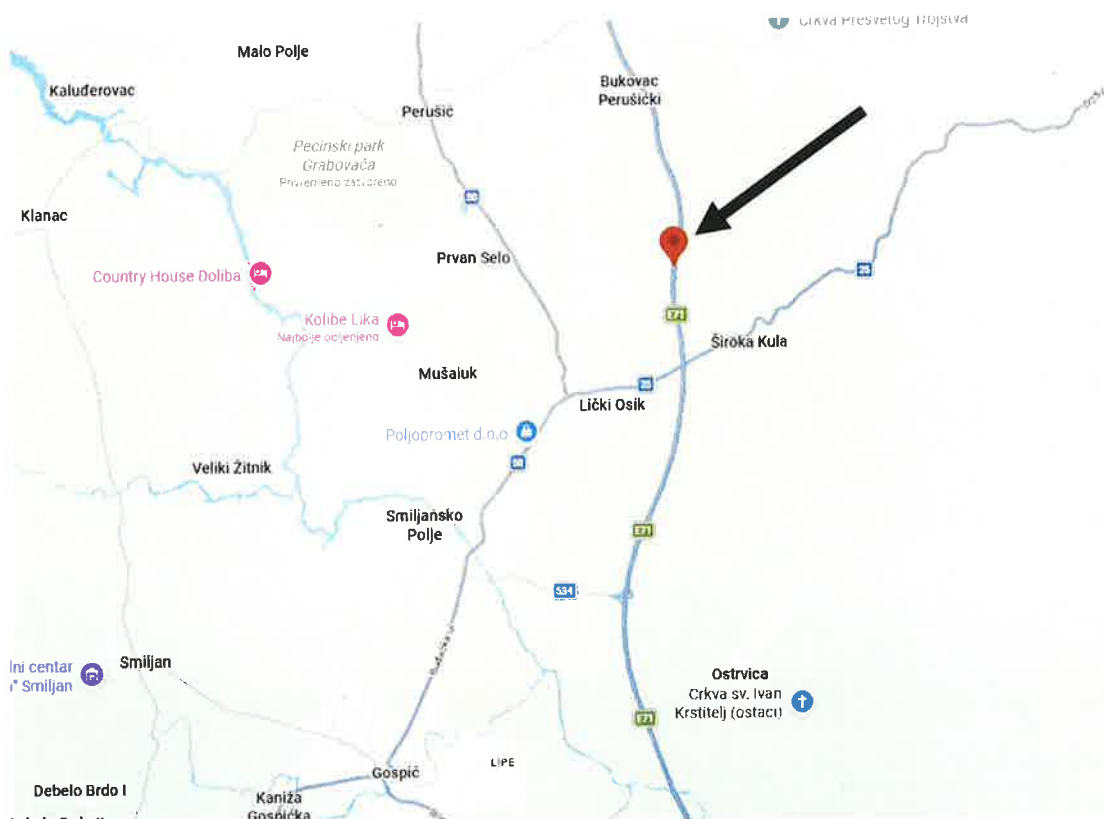
Prikaz lokacije na Google karti