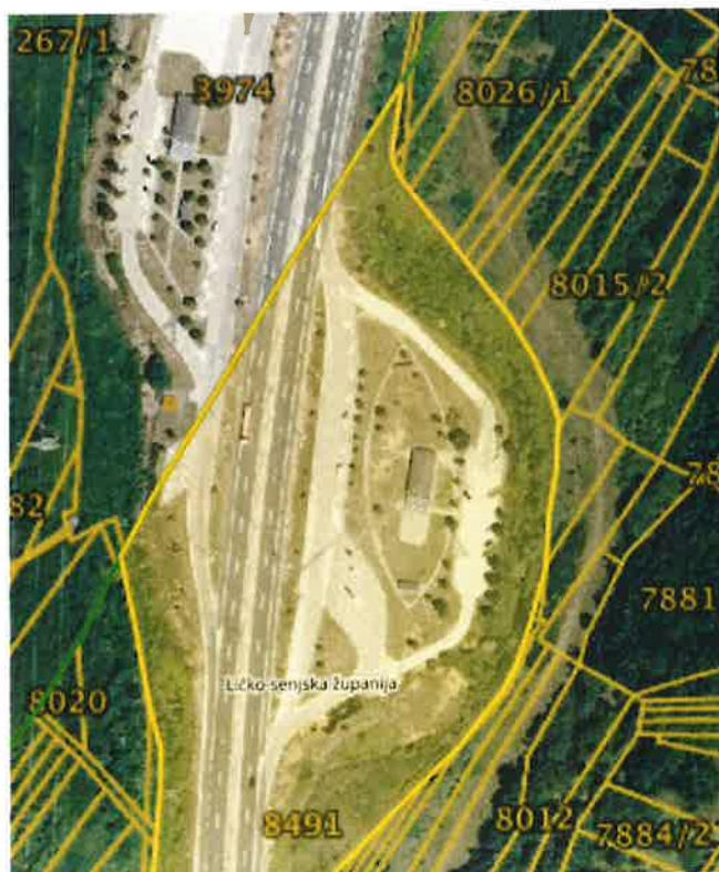
Prikaz lokacije Lički Osik – istok na DOF-u

PUO Lički Osik – istok nalazi se na k.č.br. 8491, k.o. Široka Kula, s istočne strane autoceste i moguće mu je pristupiti iz smjera Splita prema Zagrebu, dok se PUO Lički Osik – zapad nalazi k.č.br. 3974, k.o. Lički Osik I, sa zapadne strane autoceste i moguće mu je pristupiti iz smjera Zagreba prema Splitu.