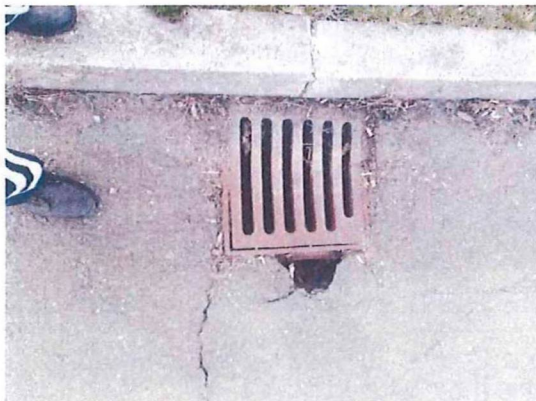
PUO SESVETE ZAPAD