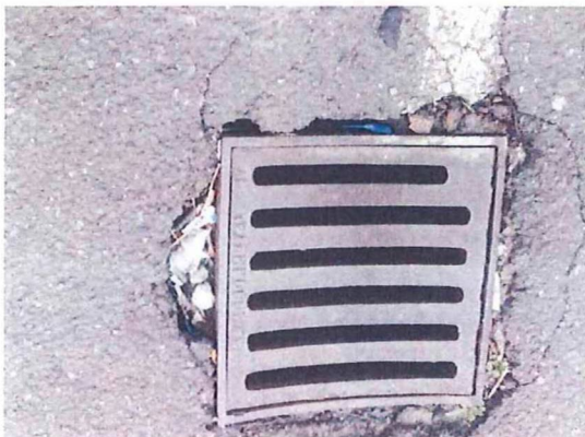
STR 2 00 3