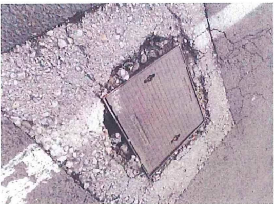
PUO JEŽEVNO JUG