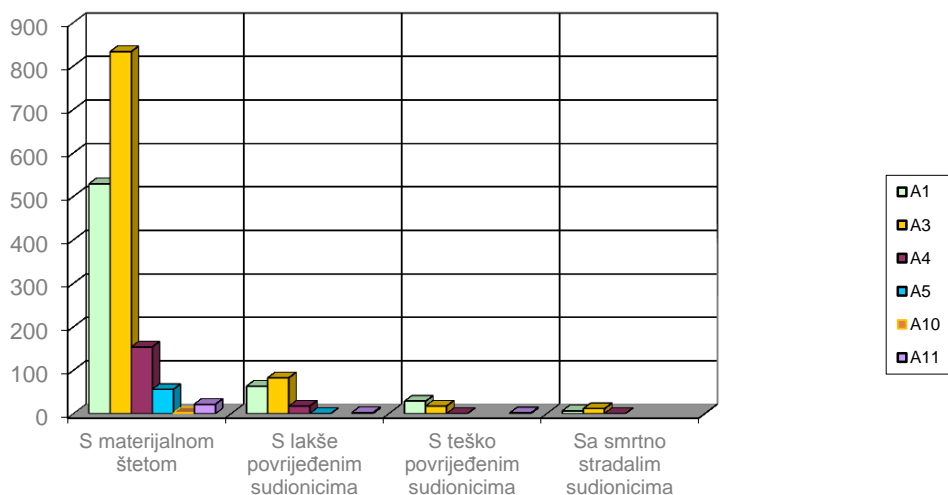
Struktura broja nesreća po posljedicama u 2016.