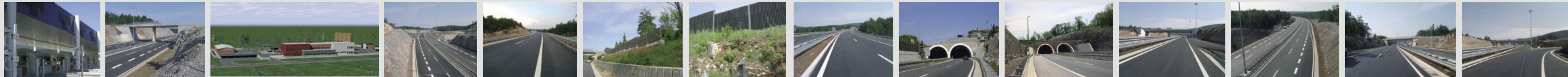
NAPLATNA POSTAJA "RUPA" COKP "RUPA" TUNEL "JUŠIĆI" TUNEL "JUŠIĆI"

Kao početni dio Jadransko Jonskog smjera ovaj longitudinalni cestovni smjer ima izuzetno značenje za buduću razvoj 7 zemalja istočne obale Jadranskog i Jonskog mora (od Italije preko Slovenije, Hrvatske, Bosne i Hercegovine, Crne Gore do Albanije i Grčke), a u transverzalnom smjeru Rijeka - Ljubljana dodatno prometno i gospodarski valorizira prostore Srednje Europe i Sjevernog Jadrana. Posebno je značajna za razvitak glavne hrvatske luke Rijeke i za međusobno povezivanje sjevernojadranskih luka Rijeke, Kopra, Trsta i Venecije. Autocesta je podijeljena na 2 sektora: Sektor Rupa - Rijeka i Sektor Rijeka - Žuta Lokva. Sektor Rupa - Rijeka u potpunosti je izgrađen i u prometu, dok je Sektor Rijeka - Žuta Lokva u fazi izrade projektne dokumentacije i projektne pripreme.